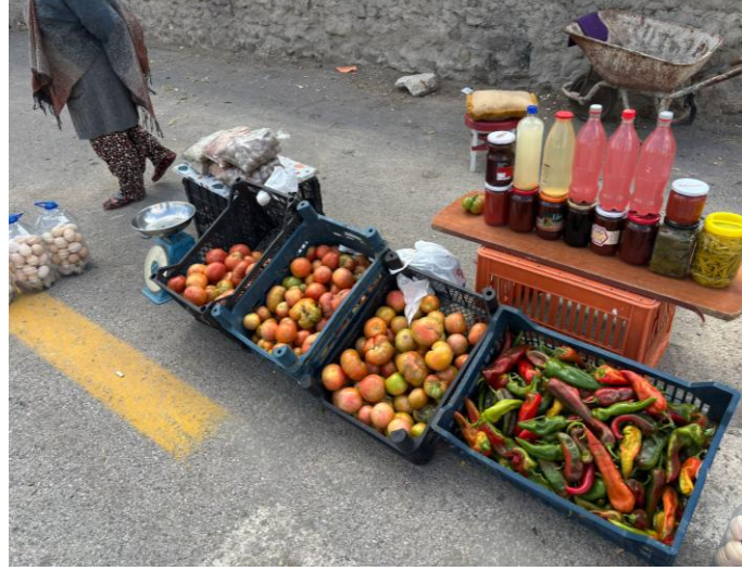
Şekil 1. Kırsalda artı ürünün ev içi işlenmesi ve değerlendirilmesi (Katılımcı K-1 tarafından paylaşılan saha görsel)

Yukarıda yer verilmiş olan Şekil 1’ de görüldüğü üzere üretim süreçlerinin kayıplarını telafi eden kurucu bir unsur olduğunu ortaya koymaktadır. Katılımcılar, tarımsal faaliyetlerin azalmasıyla birlikte aile içi iş bölümünün dönüştüğünü, ekonomik dayanışma pratiklerinin ise giderek kırılgan hale geldiğini ifade etmektedir. Özellikle kırsal alanlardan kente göç eden ailelerde, kuşaklar arası dayanışmanın zayıfladığı, tarımsal bilgi ve kültürel hafızanın aktarımında kopukluklar yaşandığı gözlemlenmiştir. Kentsel alanlarda tarımla ilişkisini sürdüren aileler ise mekânsal aidiyet algılarının belirsizleştiğini ve ekolojik risklere karşı daha savunmasız hale geldiklerini dile getirmiştir. Bununla birlikte, bazı ailelerin ekolojik farkındalık geliştirdiği ve sınırlı da olsa sürdürülebilir tarım pratiklerini sürdürmeye çalıştığı görülmektedir. Bu durum, ailelerin Antroposen koşullarında yalnızca edilgen aktörler olmadığını, aynı zamanda uyum ve direnç stratejileri geliştirdiğini ortaya koymaktadır.